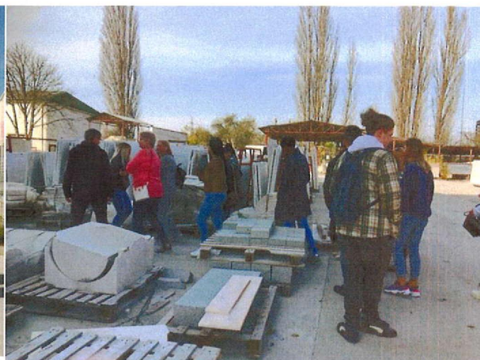
Deplasare informare antreprenariat Cluj Napoca