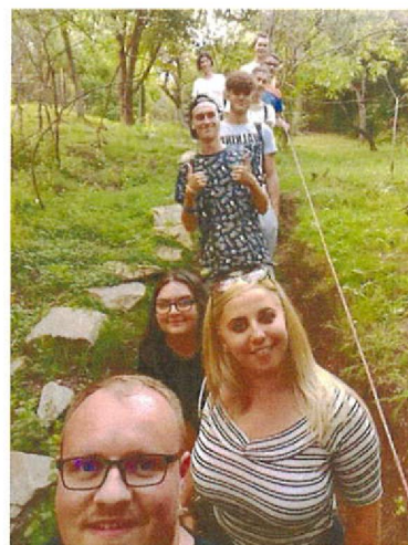
Deplasare la Centrul de afaceri Călan și firme din domeniul ingineriei